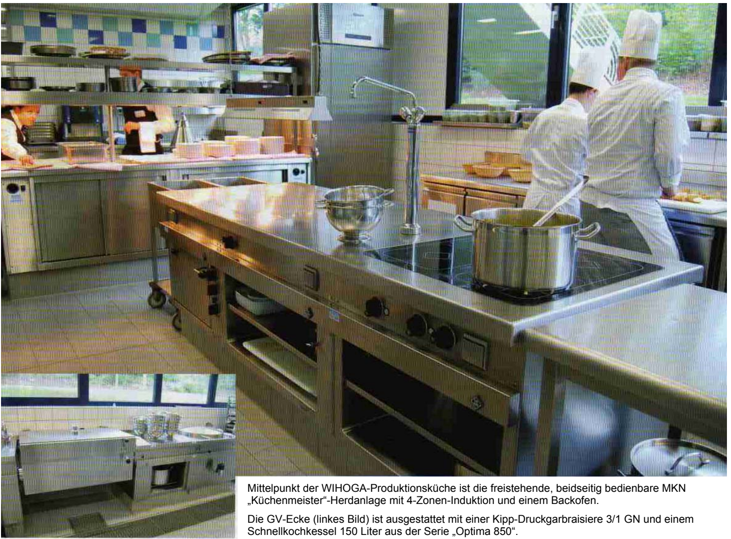
Mittelpunkt der WIHOGA-Produktionsküche ist die freistehende, beidseitig bedienbare MKN „Küchenmeister“-Herdanlage mit 4-Zonen-Induktion und einem Backofen.