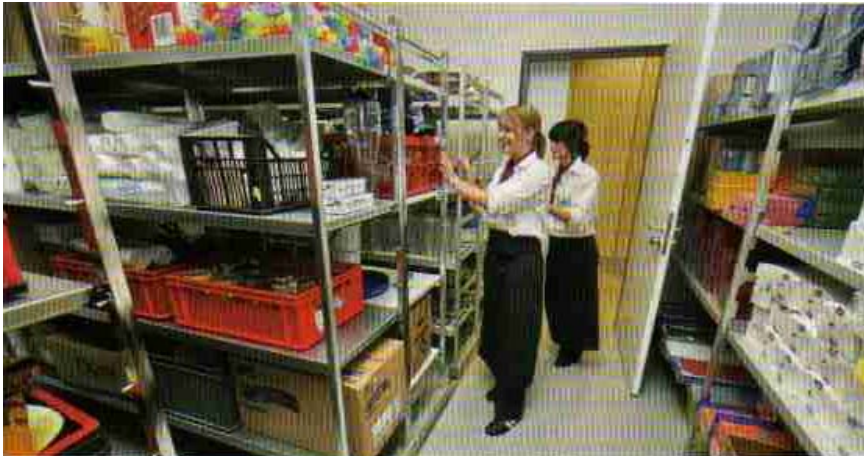
Extrem Platz sparend und reinigungsfreundlich: das Regalsystem auf Schienen.

erfüllt werden konnten. Hier ist die Patisserie vorgesehen - die benötigten Anschlüsse, etwa für Kühlgeräte und einen Konditorei-Backofen, ragen aus der Wand. In diesem modernen Gesamt-Umfeld noch für den Bereich Patisserie Sponsoren zu finden, scheint nicht unmöglich zu sein. Schon heute führen die Firmen, die an der Einrichtung beteiligt waren, Kunden und Planer gerne durch die Küchenbereiche und haben entsprechend ein Auge darauf, dass alles in Ordnung ist und bleibt.