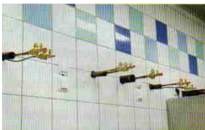
Anschlüsse zur zentralen Kühlanlage - für Geräte der künftigen Patisserie

Da sämtliche Großküchen-Geräte für den Anschluss an die Innos Küchenleittechnik vorbereitet sind, ist es gut möglich, in Zukunft einmal den Schülern sämtliche Garprozess-Stufen über einen Beamer zu zeigen und verständlich zu machen.